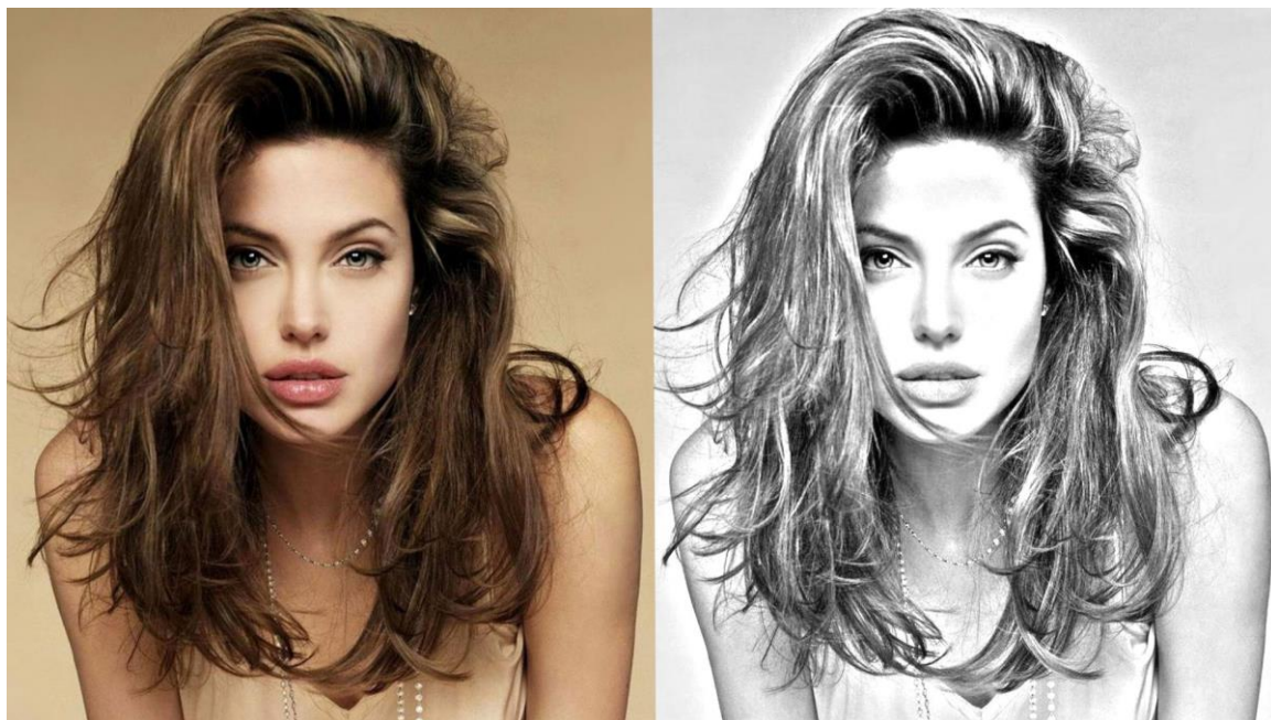
Efeito Desenho à lápis