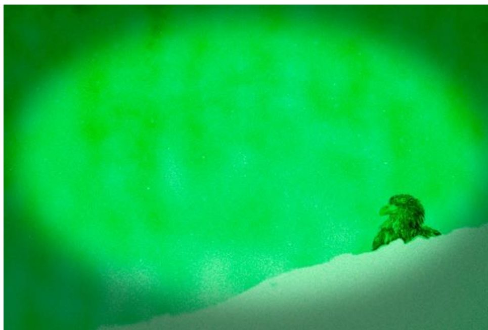
Efeito Visão Noturna